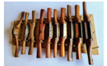
27 houten spookschaafjes, 10x