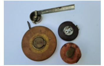
4 rolmaat 5x