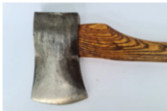
54 bijl, Eagle Edge Tool