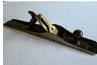
23 Stanley 8, rib, USA