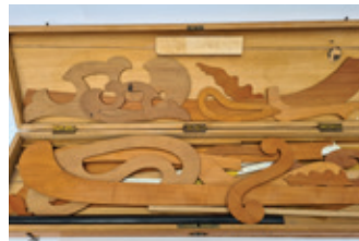
49 kist met tekensjablonen, Faber