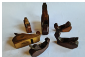
30 vioolschaafjes, 6x