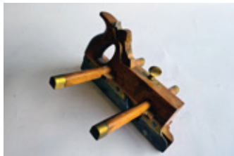
44 Engelse ploeg met greep