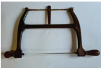
21 spanzaagje, 30cm blad