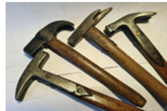
79 4x klauwhamer