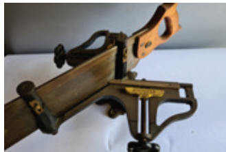
19 verstekzaag, Stanley 100