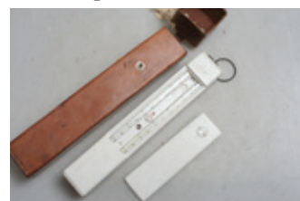
91 Psychrometer voor het bepalen van de vochtigheidsgraad