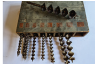
20b kist met 11 boren