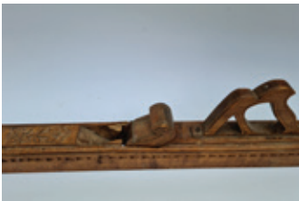
9 voorloper met snijwerk