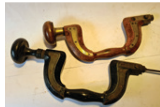
59 2x houten booromslag