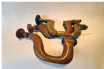
58 3x houten booromslag