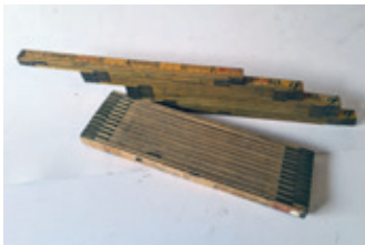
77 2x duimstok