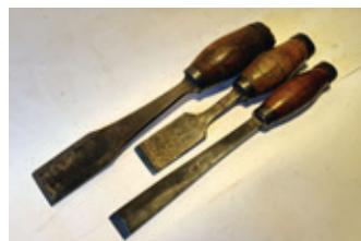
82 3x beitel