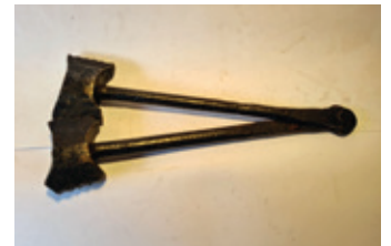
76 profieleerhamer ?