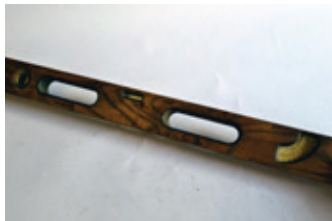
48 waterpas met verstelbare bel, Lauritzen Kopenhagen