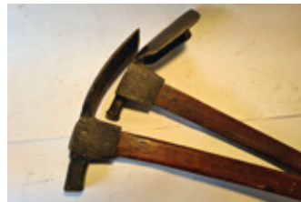
74 2x dissel