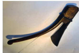
75 Franse dissel