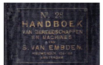
31 Catalogus Van Embden