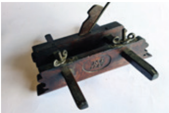
47 gedateerde ploegschaaf 1847