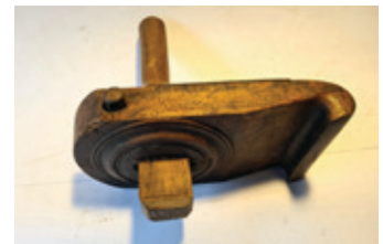
56 2x krooschaaf