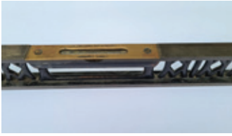
1 machine waterpas, Rabone