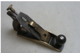
85 GTL bronzen schaaf (type nr. 4).