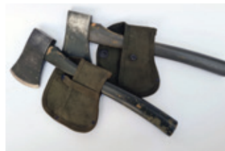
55 2 bijltjes USA WO2