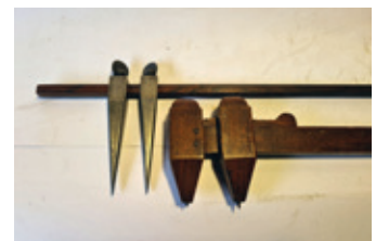
64 2x stokpasser