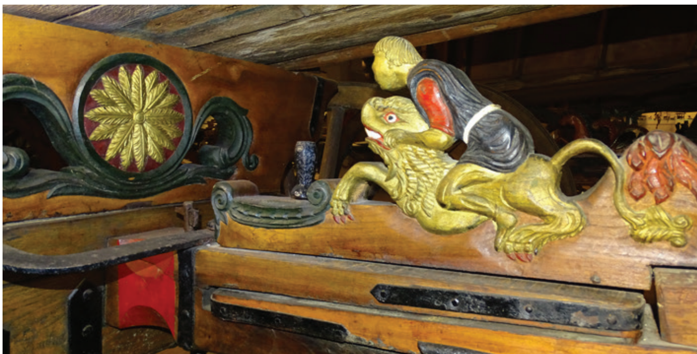
Snijwerkversiering onder de wagen

De inschrijving is inclusief de lunch en toegang tot het mu- seum. Betaling graag vóór 14 mei. Bij betaling na 14 mei een mailtje naar penningmeester@ ambachtengereedschap.nl of bel 0317 616363