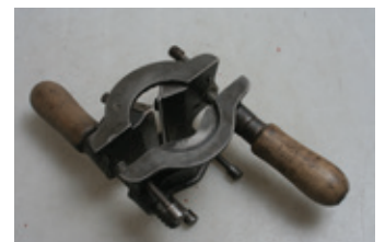
84 Verstelbare schaaf voor rondhout, met voorsnijder