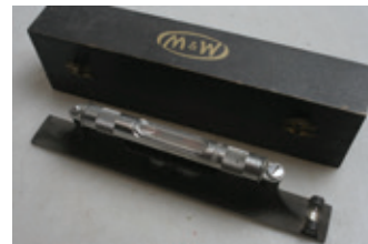
87 Moore & Wright machine-waterpas