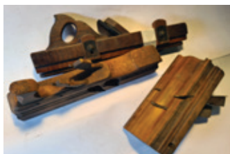
62 2- en 3-master