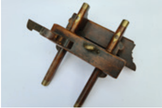
5 Engelse ploegschaaf