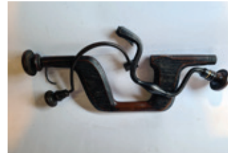
67 3x booromslag