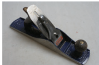
86 Record nr. 5 1/2.