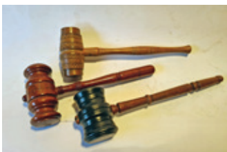
81 3x voorzittershamer