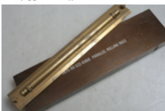
89 messing parallellineaal in kistje