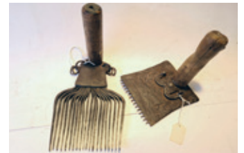
80 2x kam