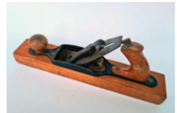
46 Stanley 26