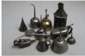
38 11 oliekannetjes