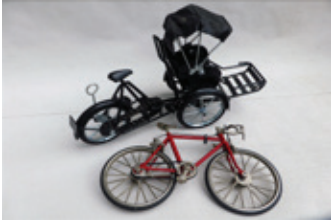
37 twee miniatuur fietsen