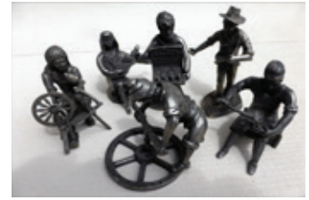
36 tinnen ambachten