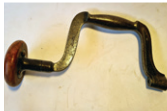
78 Zweedse booromslag