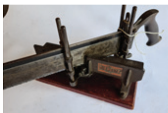
29 verstekzaag, Ulmia 348