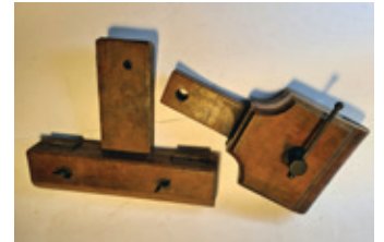
68 zagenklem 2x