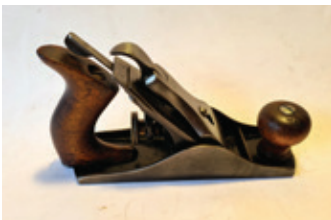
57 Stanley 2