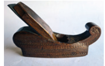
40 gerfschaaf, bewerkt 1837