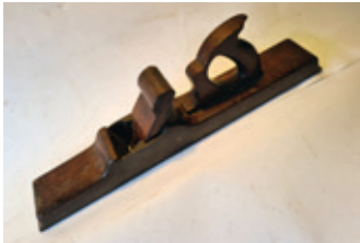
65 infill schaaf