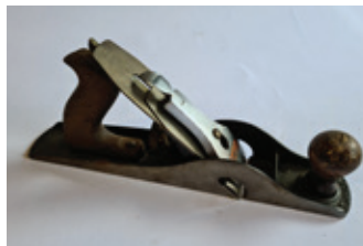
22 Stanley 10 (Eng)