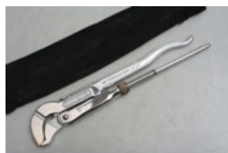
90 Pijpentang Rothenberger speciale editie 50 jarig bestaan