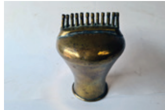
66 wat is dit?