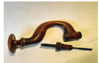
60 booromslag met schroef- draadkuiken