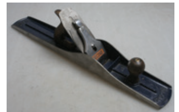
88 Record nr. 8.