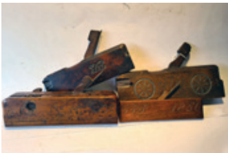
42 4x gedateerde schaven sponningschaaf, 1702