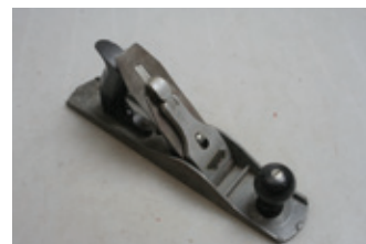
83 Millers Falls nr. 814 schaaf (type nr. 5).