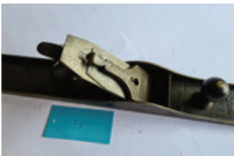
24 Stanley 8, glad, USA