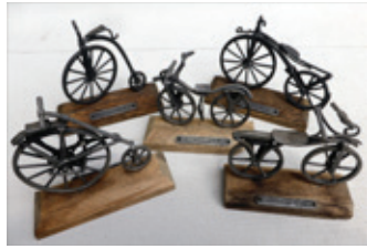
34 fietsminiatuur 5x