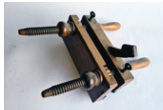
45 ploegschaaf, SVE