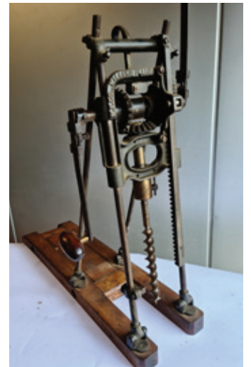
20a stoeltjesboor Millers