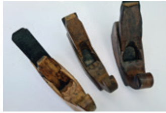
2 gerfschaafjes 3x